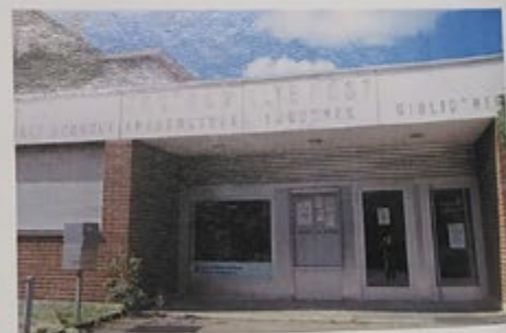
Gottesdienste feiern in der Alten Post

wuchs, und mit der Zeit wurde auch der Platz im EGW-Raum eng und genügte den feuerpolizeilichen Vorschriften nicht mehr. Ein neuer Raum wurde 1999 in der Alten Post (Bild rechts) als Gemeindebibliothek bewilligt. Wir konnten wir einziehen.