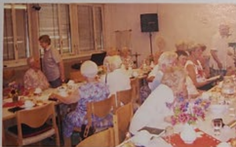
EGW-Raum bei der Swisscom

Im Gebäude, wo die Swisscom untergebracht war, wurde ein Raum frei, der gemietet werden konnte und vorerst für die Jugendarbeit bereitstand. Die ganze Gemeinde kehrte im Jahr 2000 dort ein. Somit ging der Wunsch für Morgengottesdienste in Erfüllung. Vorgängig dieser Aktionen erlebten wir die Zeit, wo die Zweispurigkeit ein Ende nahm und an Stelle der Brüdergemeinschaft ein Ortsvorstand gebildet und wir dem Bezirk Schönbühl zugeordnet wurden. 1996 erfolgte der Zusammenschluss von der EG und der LKG zum Evangelischen Gemeinschaftswerk. Der Akt des Zusammenschlusses wurde im Münster in Bern gefeiert. Der