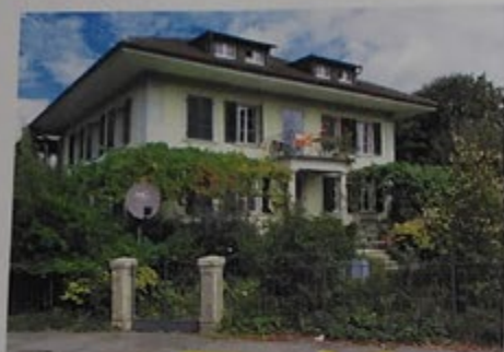
Hier fanden Bibelstunden der EG statt

Die Geschichte beginnt mit einer lockeren Verbindung von zwei Organisationen. Für die Geschichtsschreiber sind nur Angaben bis ins Jahr 1949 möglich. Frühere sind nicht mehr auffindbar. Es handelt sich hier um Leute, die einerseits zur Evangelischen Gesellschaft und andererseits zum Verband Landeskirchlicher Gemeinschaften gehörten. Dieses Gebilde wurde durch eine Brüdergemeinschaft, die zu gleichen Teilen bestückt