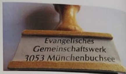
Stempel für offizielle Korrespondenz

Titel «Evangelisches Gemeinschaftswerk» war uns schon ein Begriff, bevor die intensive Suche nach einem Namen für das vereinigte Werk im Gang war. Der Stempel mit dem Ortsnamen zeigt dies deutlich. 2004 wurde der eigene Bezirk Münchenbuchsee ins Leben gerufen und ein Bezirksrat, der die Geschäfte leitet. Die Gemeinde