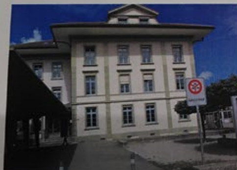
Oberes Schulhaus als Ort der Begegnung

Diejenigen, die ihre Wurzeln in der EG hatten, versammelten sich in diesem Haus (Bild) zur Bibelstunde, und die LKGLer trafen sich in der Wohnung von E.+ L. Geissbühler zur Durchführung von Bibel- und Singstunden