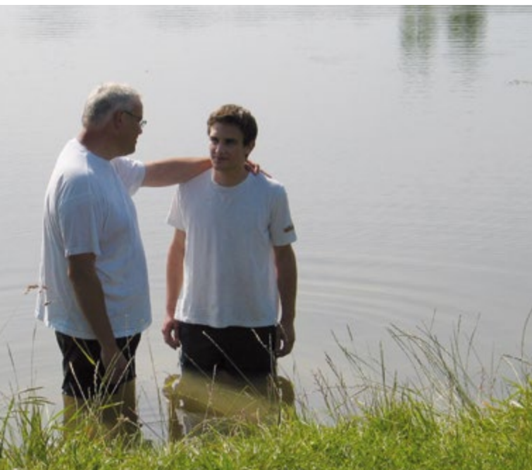
u Gottes Bund und Bekenntnis des Glaubens.

Bezeichnend für den Neuen Bund ist, dass Gott sein Gesetz nicht nur äusserlich gibt, sondern Menschen ins Herz schreibt beziehungsweise ihre Herzen neu macht und Gehorsam bewirkt. Menschen erleben dies in der Wiedergeburt, die durch den Heiligen Geist gewirkt 19 wird, und in der Heiligung, die daraus resultiert.