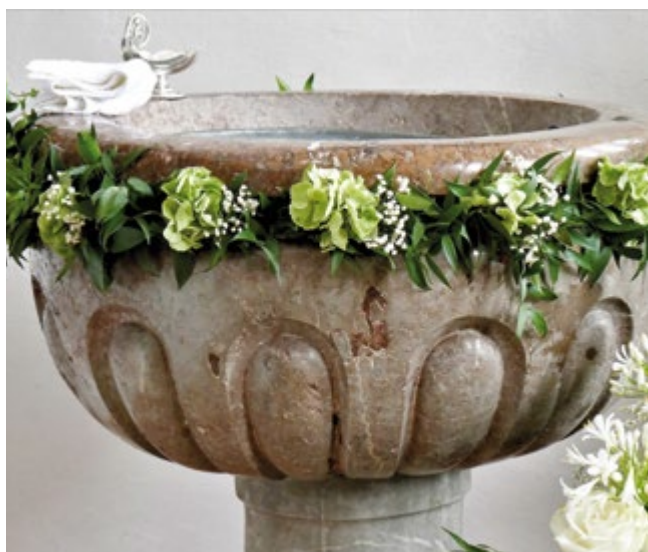
Gottes Zeichen – menschliches Handeln: Die Grösse des Taufsteins deutet an, dass die Taufe das Untertauchen einschloss.