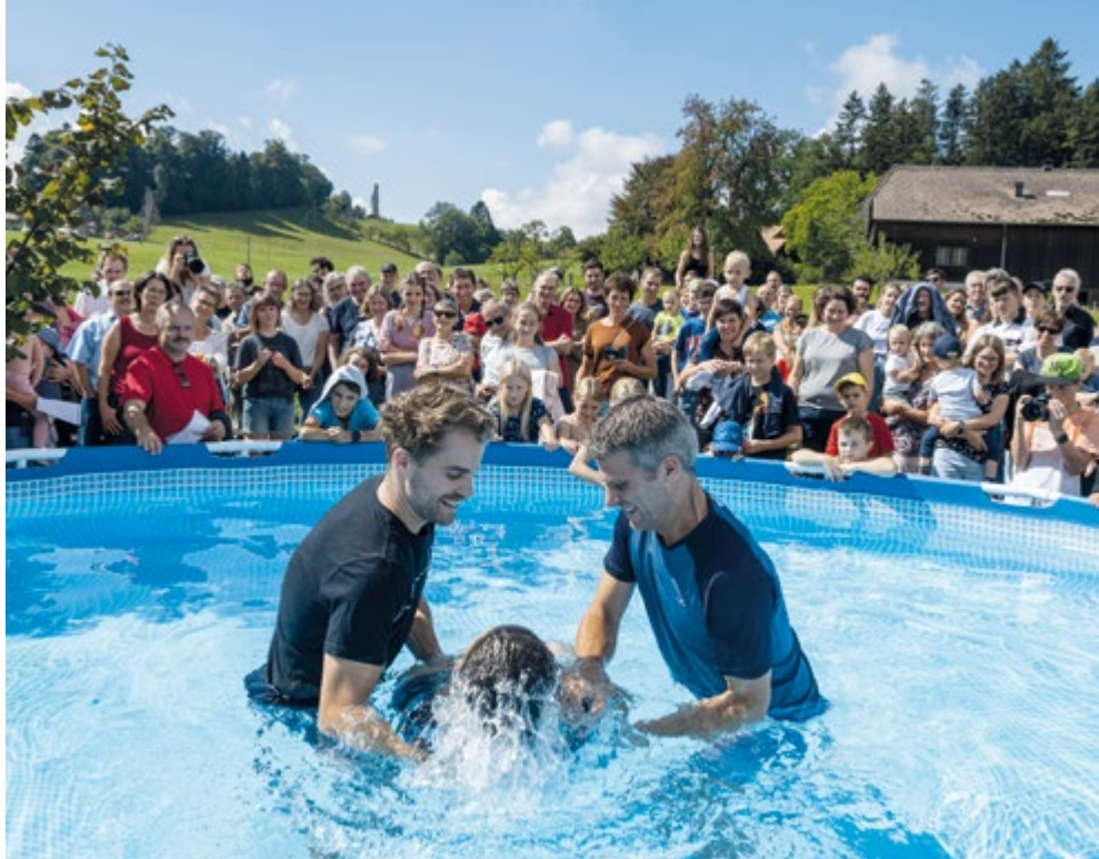
In Christi Tod getauft, damit wir aus seiner Auferstehung leben: Die Taufe im EGW Weier ist auch ein Fest der Gemeinschaft.

Das Zeichen, dass man (zu) Jesus Christus gehört – dieses Zeichen der Einheit – darf nicht zum Trennungsgrund oder